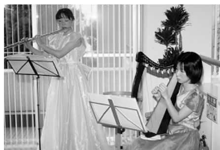
クリスマスコンサートにて

我が家には魔法のじゅうたんがあります。居間のテレビの前にひいてあり、広さは1.5畳ほどです。別に空を飛ぶわけでもありませんが、人を引きつける力は相当なもので、その上に立っているとまずお尻が引きつけられ、座ってしまいます。その後しばらくすると体全体が引きつけられて、思わず横になってしまいます。こうなるともういけません。お尻ぼかぼか、背中もぼかぼか、暖められて魔法がかかり、後は夢の中へ引きずり込まれてしまいます。ホットカーペット、それが魔法のじゅうたんです。産婦人科医をしていると「夜中に起きたりして、睡眠不足になり大変でしょう」とよく質問されます。確かに何度も夜中に起きることはありますが、元々私はいつでも、どこでもすぐ眠れるタイプなのです。朝でも昼でも夜でも、ほんの少しの時間があれば、ちょっと寝て、睡眠不足を解消していますから、寝ているところを起こされるのは苦痛になりません。産婦人科向きの体なのでしょう。それでも真冬の夜中は体が冷えてしまい、すぐに眠れないこともあります。でも魔法のじゅうたんの上では、どんなに寒い季節でも瞬時に夢の世界に誘ってくれます。魔法のじゅうたんは私の健康のひけつといえます。