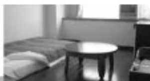
▼トイレ付きお部屋