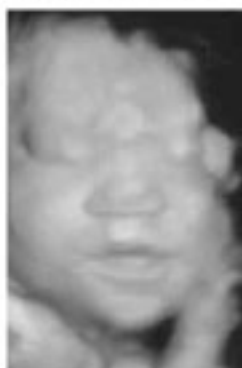
▼妊娠38週 生まれる直前です。