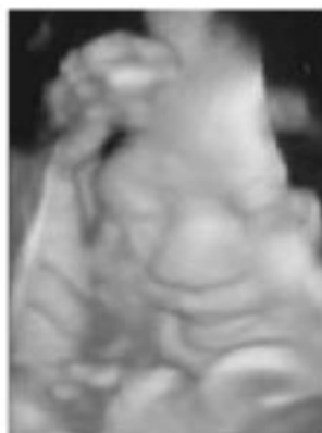
▲妊娠34週 少し微笑んでいるようですね。何かいい夢でも見ているのでしょうか。