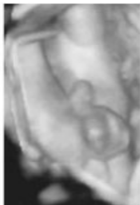
▼妊娠22週 あくびをしているように口を開けている横顔です。