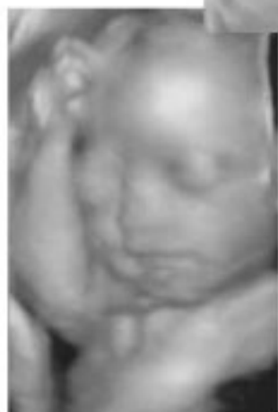
▲妊娠26週 赤ちゃんの顔です。ちょうどこの当たりに手を持ってきています。