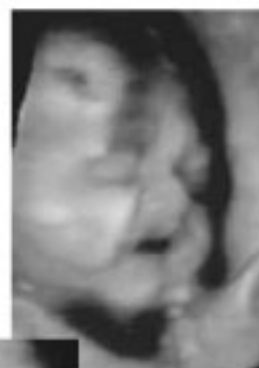
▲妊娠37週 生まれる少し前の赤ちゃんの顔です。